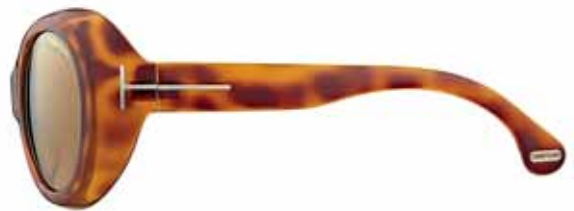
379 AVANA CHIARA LUCIDA, LENTI MARRONE SHINY LIGHT HAVANA, BROWN LENSES