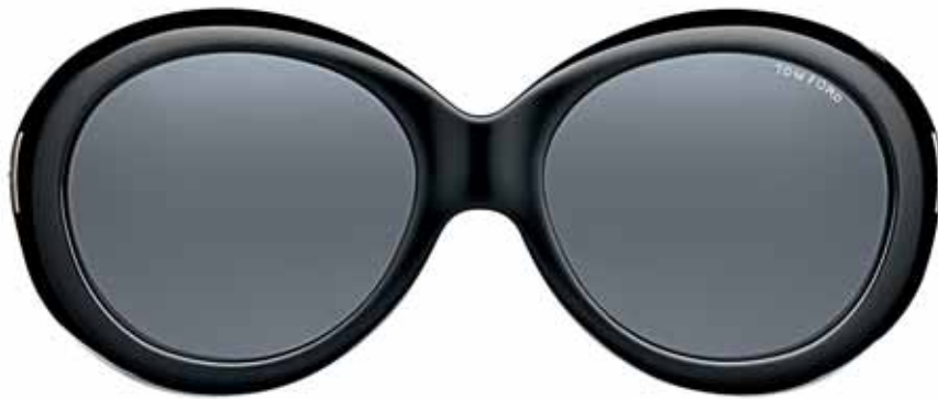
B5 NERO LUCIDO, LENTI FUMO SHINY BLACK, DARK GREY LENSES