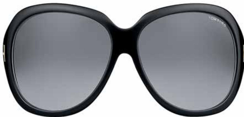
035 NERO/PERLA/AVANA CHIARA, LENTI FUMO BLACK/PEARL/LIGHT HAVANA, DARK GREY LENSES