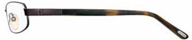
J63 MARRONE SCURO SEMILUCIDO, TERMINALI CORNO MARRONE/MARRONE CHIARO/MARRONE SCURO SEMI-SHINY DARK BROWN, BROWN HORN/LIGHT BROWN/ DARK BROWN TEMPLE TIPS