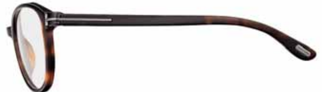
820 AVANA SCURA LUCIDA SHINY DARK HAVANA