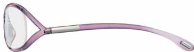
486 AMETISTA TRASPARENTE TRANSPARENT AMETHYST