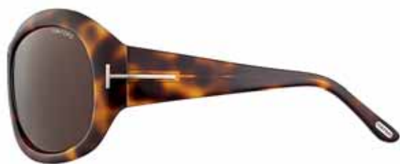
T32 AVANA SCURA MORBIDA LUCIDA, LENTI MARRONE SCURO SHINY DARK SOFT HAVANA, DARK BROWN LENSES