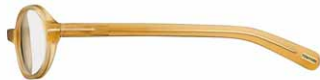
383 GIALLO OPALINO LUCIDO SHINY OPAL YELLOW