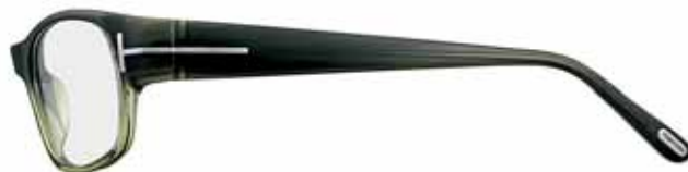
T94 BICOLORE GRIGIO/OLIVA BICOLOUR GREY/OLIVE