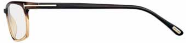
T93 BICOLORE MARRONE/AMBRA BICOLOUR BROWN/AMBER