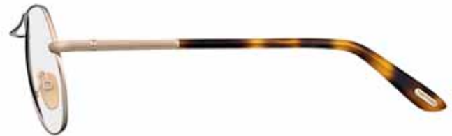
772 ORO ROSÉ LUCIDO, TERMINALI AVANA LUCIDO SHINY ROSE GOLD, SHINY HAVANA TEMPLE TIPS