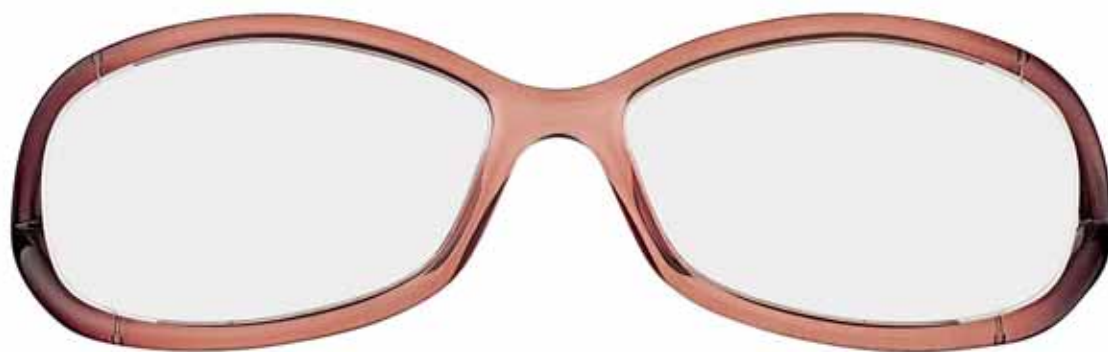
390 BRUCIATO TRASPARENTE TRANSPARENT RUST BROWN