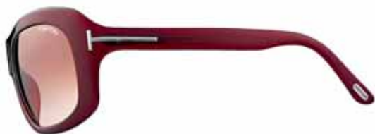
211 BORDEAUX TRASPARENTE LUCIDO, LENTI RUGGINE SFUMATO SHINY TRANSPARENT BURGUNDY, GRADIENT RUST BROWN LENSES