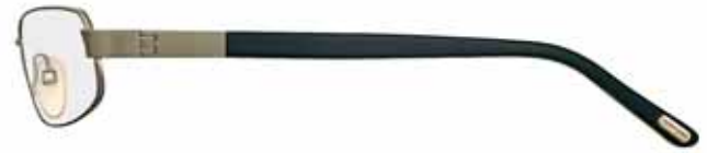
976 VERDE OLIVA SATINATO LUCIDO, TERMINALI NERO/BIANCO LANA SHINY SATIN OLIVE GREEN, BLACK /WOOL WHITE TEMPLE TIPS