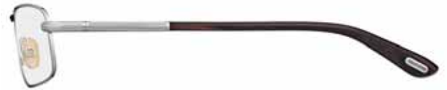
753 PALLADIO SEMILUCIDO, TERMINALI NERO RIGATO BORDEAUX SEMI-SHINY PALLADIUM, STRIPED BLACK/BURGUNDY TEMPLE TIPS