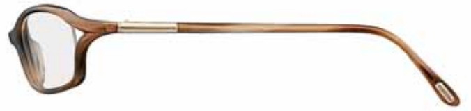
R66 EFFETTO CONCHIGLIA BRONZO BRONZE SHELL EFFECT