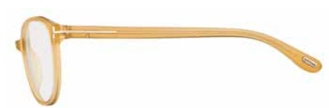
383 MIELE OPALINO LUCIDO SHINY OPAL HONEY