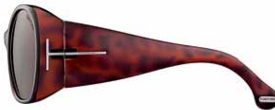
182 AVANA SCURA LUCIDA, LENTI MARRONE SCURO SHINY DARK HAVANA, DARK BROWN LENSES