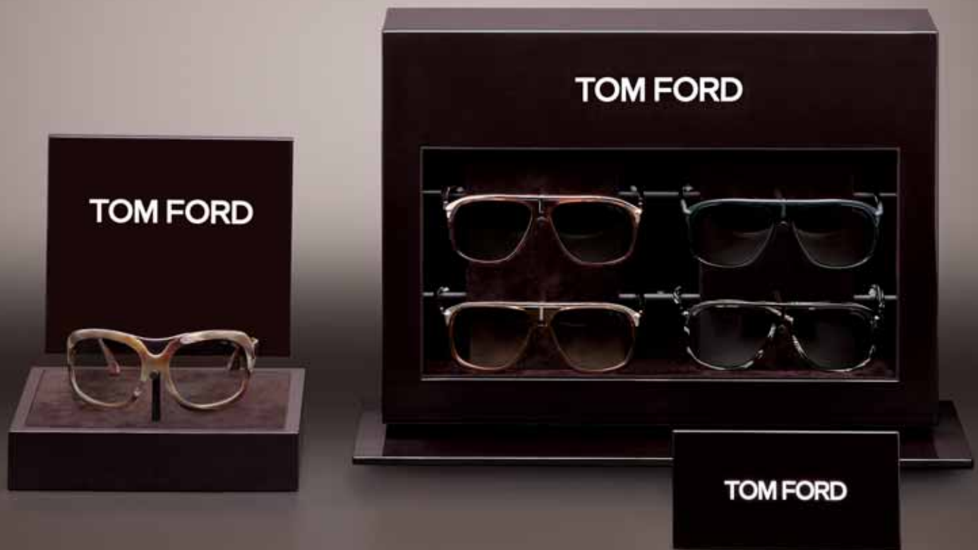
SINGLE DISPLAY UNIT, FOUR PIECE DISPLAY UNIT AND LOGO PLAQUE