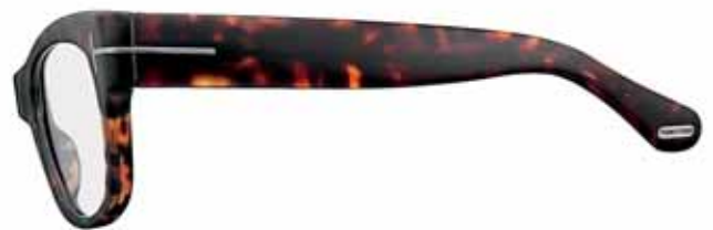
182 AVANA SCURA LUCIDA SHINY DARK HAVANA