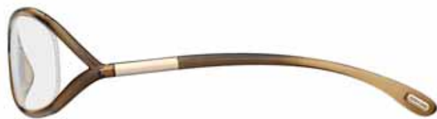
804 MARRONE TRASPARENTE TRANSPARENT BROWN