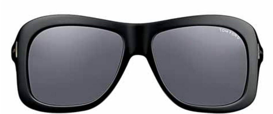
B5 NERO LUCIDO, LENTI FUMO SHINY BLACK, DARK GREY LENSES