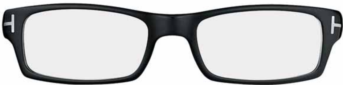
B5 NERO LUCIDO SHINY BLACK