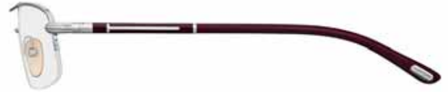
512 RUTENIO CHIARO LUCIDO, SMALTO BORDEAUX, TERMINALI BORDEAUX SEMI-SHINY LIGHT RUTHENIUM, BURGUNDY EPOXY, BURGUNDY TEMPLE TIPS