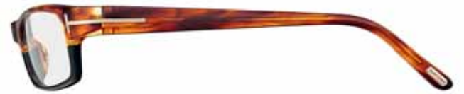
416 BICOLORE AVANA/NERO BICOLOUR HAVANA/BLACK