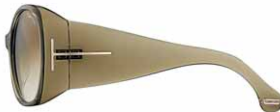
769 VERDE OLIVA TRASPARENTE, LENTI VERDE OLIVA SFUMATO SHINY TRANSPARENT OLIVE GREEN, GRADIENT OLIVE GREEN LENSES