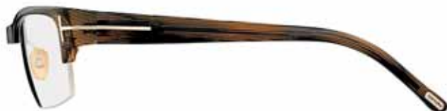
R93 MARRONE MOIRÉ MOIRÉ BROWN