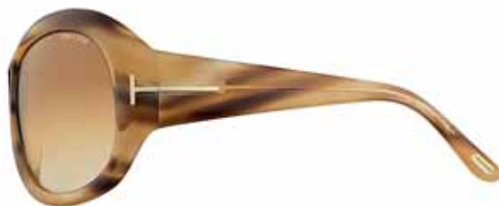
T40 CONCHIGLIA MARRONE LUCIDA, LENTI MARRONE SFUMATO SHINY BROWN COQUILLAGE, GRADIENT BROWN LENSES