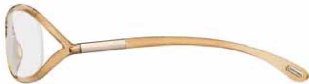
614 CHAMPAGNE TRASPARENTE TRANSPARENT CHAMPAGNE