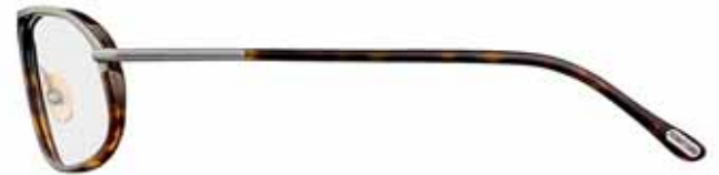
96 AVANA SCURA LUCIDA, METALLO ANTRACITE SEMILUCIDO SHINY DARK HAVANA, SEMI-SHINY GUNMETAL METAL