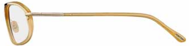
383 MIELE OPALINO LUCIDO, METALLO ORO ROSÉ LUCIDO SHINY OPAL HONEY, SHINY ROSE GOLD METAL