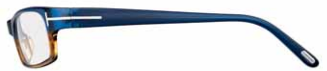
418 BICOLORE BLU/AVANA BICOLOUR BLUE/HAVANA