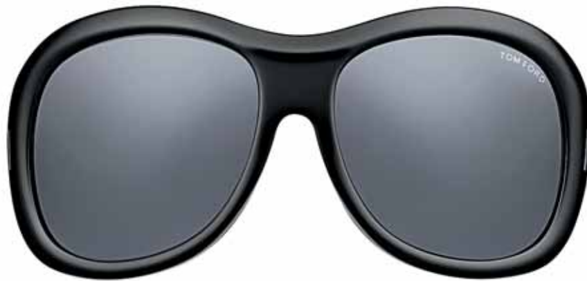
B5 NERO LUCIDO, LENTI FUMO SHINY BLACK, DARK GREY LENSES