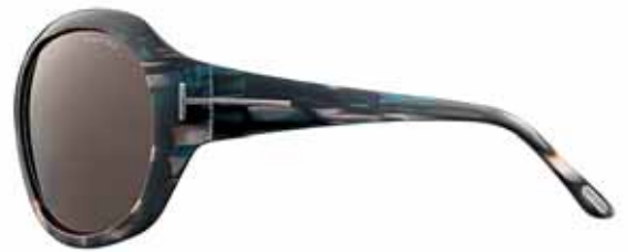
T62 MARRONE TURCHESE MADREPERLATO, LENTI MARRONE SCURO MOTHER-OF-PEARL BROWN/TURQUOISE, DARK BROWN LENSES