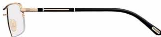
772 ORO ROSÉ LUCIDO, SMALTO NERO, TERMINALI NERO SHINY ROSE GOLD, BLACK EPOXY, BLACK TEMPLE TIPS