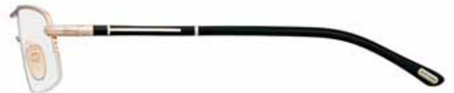
772 ORO ROSÉ LUCIDO, SMALTO NERO, TERMINALI NERO SHINY ROSE GOLD, BLACK EPOXY, BLACK TEMPLE TIPS