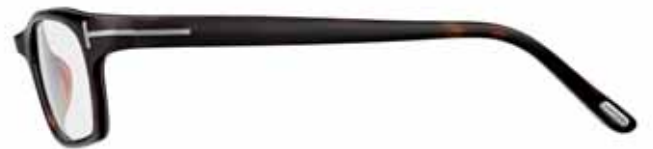
T35 AVANA SCURA/RUGGINE PERLATO DARK HAVANA/PEARL RUST BROWN