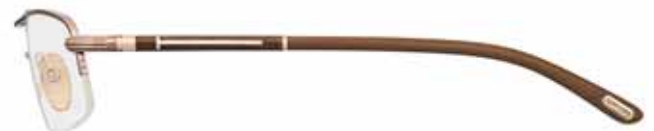
734 MARRONE LUCIDO, SMALTO MARRONE CHIARO SU METALLO ORO ROSÉ, TERMINALI MARRONE CHIARO SHINY BROWN, LIGHT BROWN EPOXY ON ROSE GOLD METAL, LIGHT BROWN TEMPLE TIPS