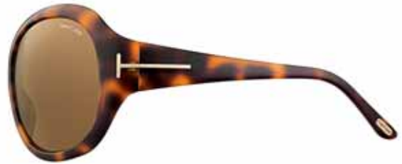
T32 AVANA SCURA MORBIDA LUCIDA, LENTI MARRONE SHINY DARK SOFT HAVANA, BROWN LENSES