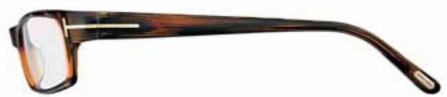
R93 MARRONE MOIRÉ MOIRÉ BROWN