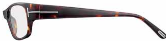
182 AVANA SCURA LUCIDA SHINY DARK HAVANA