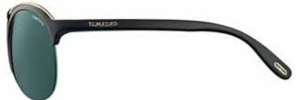
199 NERO LUCIDO, BARRA ORO ROSÉ LUCIDO, LENTI VERDE FUMO SHINY BLACK, SHINY ROSE GOLD TOP BAR, SMOKE GREEN LENSES