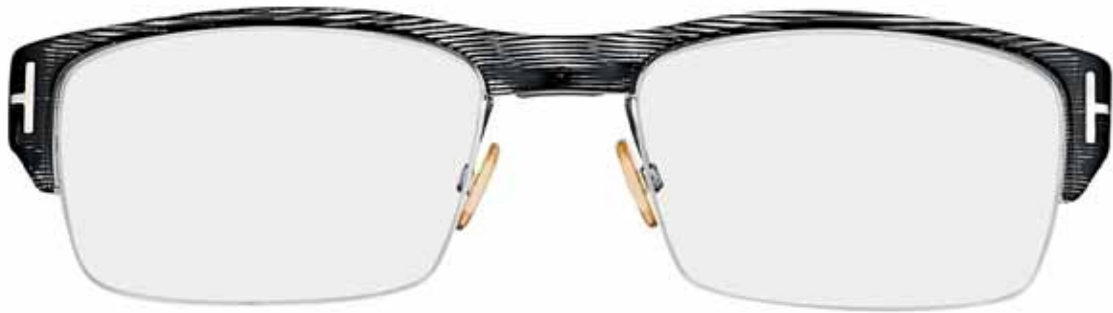
R92 NERO MOIRÉ MOIRÉ BLACK