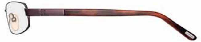
728 VINACCIA LUCIDO, TERMINALI CORNO ROSSO/MATTONE/VIOLA SHINY WINE RED, RED HORN/BRICK RED/VIOLET TEMPLE TIPS