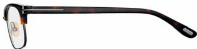
820 ANTRACITE LUCIDO, AVANA SCURA LUCIDA SHINY GUNMETAL, SHINY DARK HAVANA