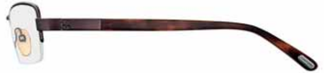
728 VINACCIA LUCIDO, TERMINALI CORNO ROSSO/MATTONE/VIOLA SHINY WINE RED, RED HORN/BRICK RED/VIOLET TEMPLE TIPS