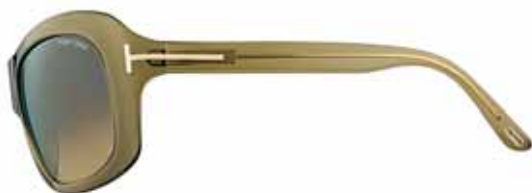
769 VERDE OLIVA TRASPARENTE, LENTI MIELE SFUMATO SHINY TRANSPARENT OLIVE GREEN, GRADIENT HONEY LENSES