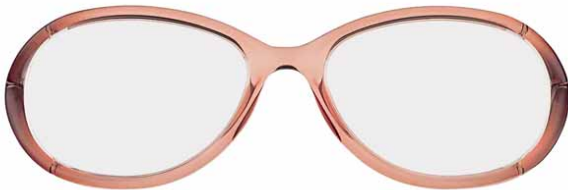
261 PESCA TRASPARENTE TRANSPARENT PEACH