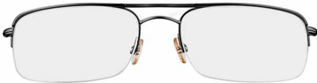
731 ANTRACITE SEMILUCIDO, SMALTO BORDEAUX, TERMINALI BORDEAUX SEMI-SHINY GUNMETAL, BURGUNDY EPOXY, BURGUNDY TEMPLE TIPS