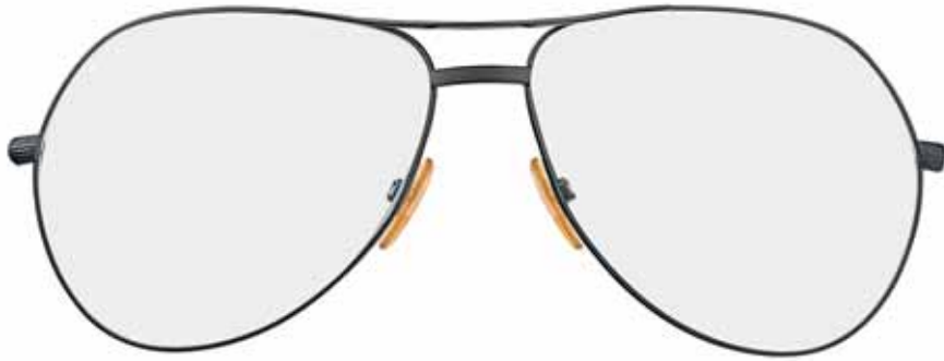
731 ANTRACITE LUCIDO, TERMINALI AVANA SCURA SHINY GUNMETAL, DARK HAVANA TEMPLE TIPS