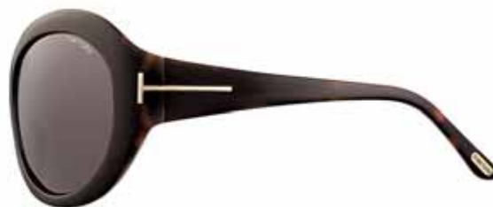
T35 AVANA SCURA/RUGGINE PERLATO, LENTI MARRONE SCURO DARK HAVANA/PEARL RUST BROWN, DARK BROWN LENSES