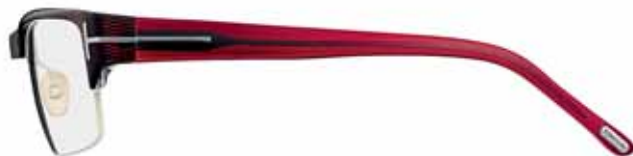
577 ROSSO/NERO/VIOLA SCURO RIGATO STRIPED RED/BLACK/DARK VIOLET