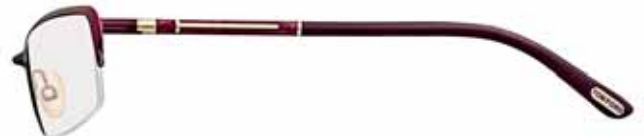
315 VINACCIA SEMILUCIDO, SMALTO VINACCIA PERLATO SU METALLO ORO ROSÉ, TERMINALI VINACCIA SEMI-SHINY WINE RED, WINE RED PEARL EPOXY ON ROSE GOLD METAL, WINE RED TEMPLE TIPS