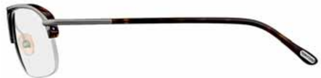
96 AVANA SCURA LUCIDA, METALLO ANTRACITE SEMILUCIDO SHINY DARK HAVANA, SEMI-SHINY GUNMETAL METAL