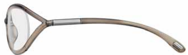
906 TORTORA TRASPARENTE TRANSPARENT DOVE GREY