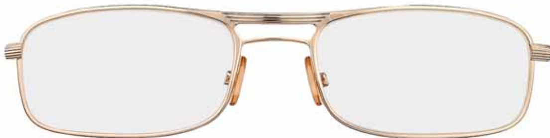
772 ORO ROSÉ LUCIDO, TERMINALI MARRONE RIGATO SHINY ROSE GOLD, STRIPED BROWN TEMPLE TIPS