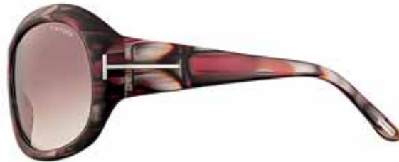
T61 BORDEAUX MADREPERLATO, LENTI BORDEAUX SFUMATO MOTHER OF PEARL BURGUNDY, GRADIENT BURGUNDY LENSES