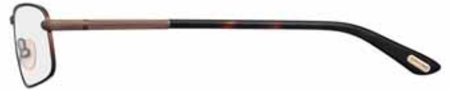
414 MARRONE SEMILUCIDO, TERMINALI AVANA SCURO SEMI-SHINY BROWN, DARK HAVANA TEMPLE TIPS