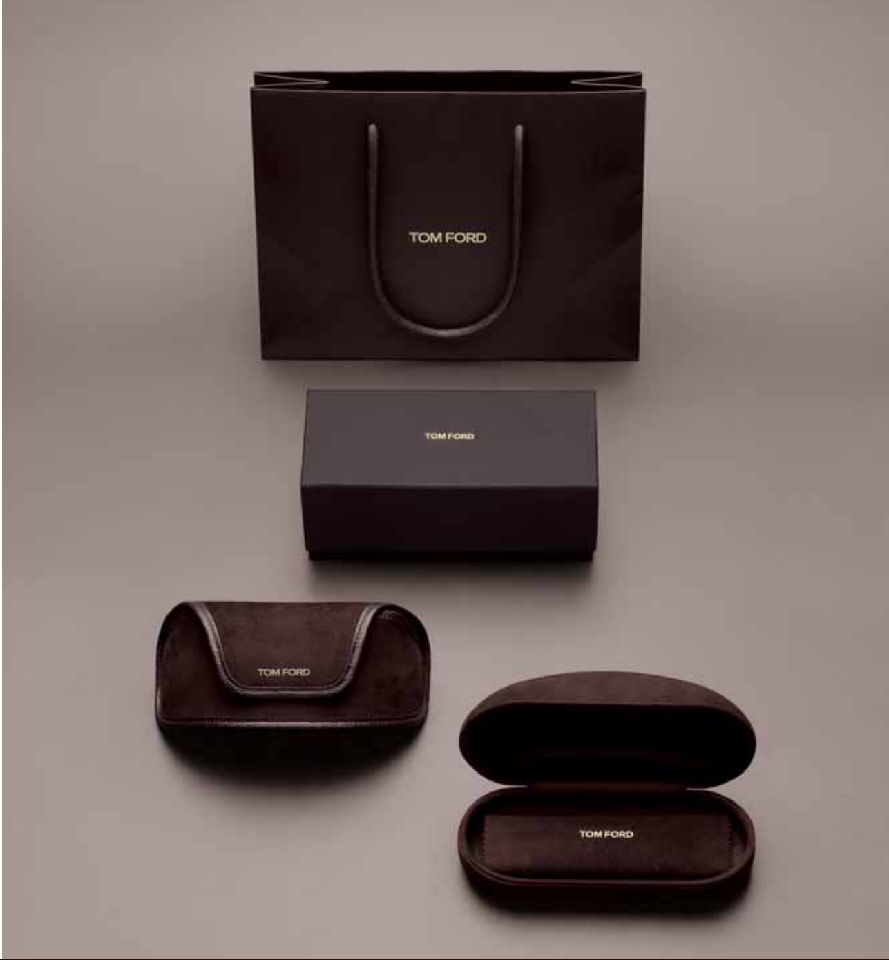
MEN'S PACKAGING SAMPLES