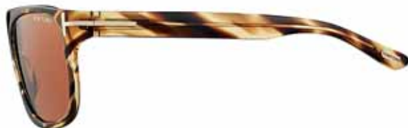
T34 AVANA MARRONE/AMBRA, LENTI MARRONE CHIARO BROWN/AMBER HAVANA, LIGHT BROWN LENSES