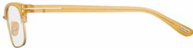
383 ORO ROSÉ LUCIDO, MIELE OPALINO LUCIDO SHINY ROSE GOLD, SHINY OPAL HONEY