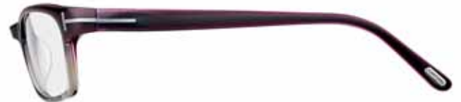
411 VIOLA SFUMATO GRIGIO SHADED VIOLET/GREY