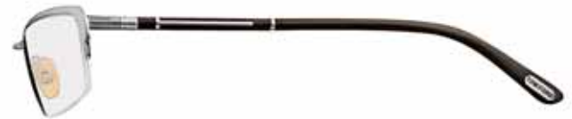
337 RUTENIO CHIARO LUCIDO, SMALTO VERDONE, TERMINALI VERDONE SHINY LIGHT RUTHENIUM, DARK GREEN EPOXY, DARK GREEN TEMPLE TIPS