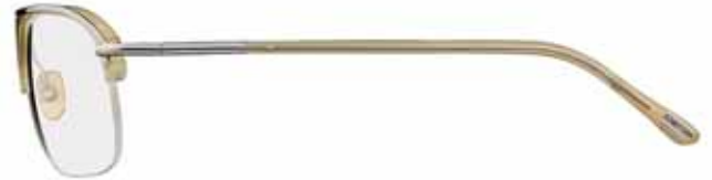
348 VERDE OPALINO LUCIDO, METALLO RUTENIO CHIARO LUCIDO SHINY OPAL GREEN, SHINY LIGHT RUTHENIUM METAL