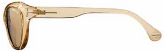
614 CHAMPAGNE LUCIDO, LENTI MARRONE CHIARO SHINY CHAMPAGNE, LIGHT BROWN LENSES