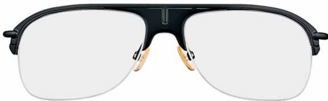
B5 NERO LUCIDO, METALLO NERO SEMILUCIDO SHINY BLACK, SEMI-SHINY BLACK METAL