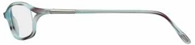
R69 EFFETTO CONCHIGLIA TURCHESE TURQUOISE SHELL EFFECT