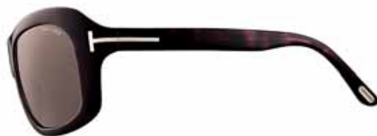
820 AVANA SCURA LUCIDA, LENTI MARRONE SCURO SHINY DARK HAVANA, DARK BROWN LENSES