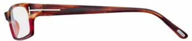
417 BICOLORE AVANA/BORDEAUX BICOLOUR HAVANA/BURGUNDY