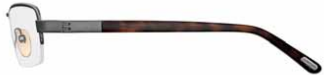
731 ANTRACITE LUCIDO, TERMINALI AVANA SCURA SHINY GUNMETAL, DARK HAVANA TEMPLE TIPS