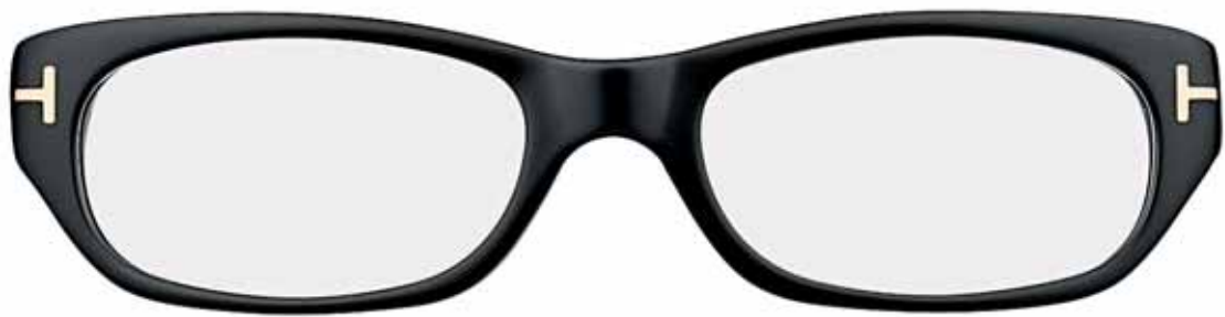
B5 NERO LUCIDO SHINY BLACK