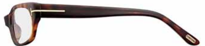
820 AVANA SCURA LUCIDA SHINY DARK HAVANA