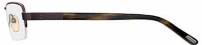
J63 MARRONE SCURO SEMILUCIDO, TERMINALI CORNO MARRONE/MARRONE CHIARO/MARRONE SCURO SEMI-SHINY DARK BROWN, BROWN HORN/LIGHT BROWN/ DARK BROWN TEMPLE TIPS