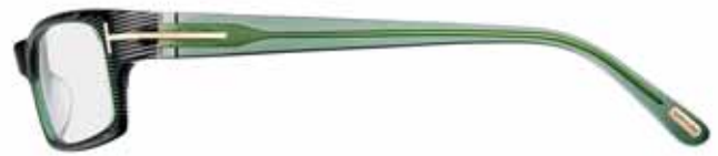
568 VERDE/NERO/VIOLA TRASPARENTE RIGATO STRIPED GREEN/BLACK/TRANSP. VIOLET