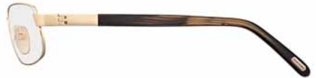
772 ORO ROSÈ LUCIDO, TERMINALI MARRONE RIGATO SHINY ROSE GOLD, STRIPED BROWN TEMPLE TIPS