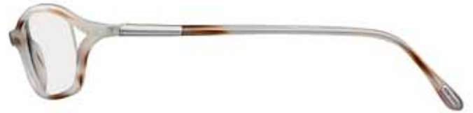
Q88 EFFETTO CONCHIGLIA PANNA CREAM SHELL EFFECT