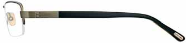
976 VERDE OLIVA SATINATO LUCIDO, TERMINALI NERO/BIANCO LANA SHINY SATIN OLIVE GREEN, BLACK /WOOL WHITE TEMPLE TIPS