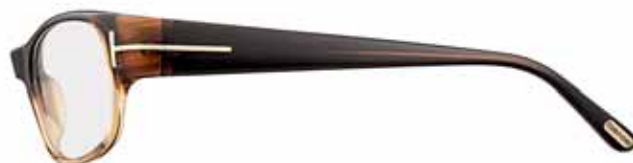
T93 BICOLORE MARRONE/AMBRA BICOLOUR BROWN/AMBER