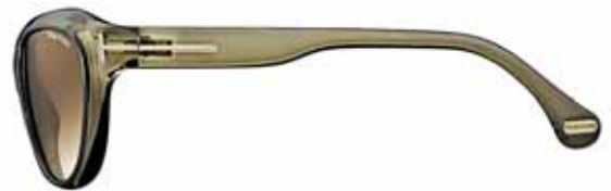
769 VERDE OLIVA TRASPARENTE, LENTI VERDE OLIVA SFUMATO SHINY TRANSPARENT OLIVE GREEN, GRADIENT OLIVE GREEN LENSES