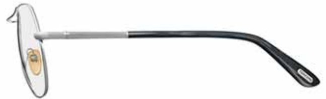
753 PALLADIO LUCIDO, TERMINALI RIGATO NERO/ARGENTO SHINY PALLADIUM, STRIPED BLACK/SILVER TEMPLE TIPS