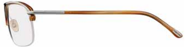
373 CORNO MARRONE CHIARO, METALLO RUTENIO CHIARO LUCIDO LIGHT BROWN HORN, SHINY LIGHT RUTHENIUM METAL