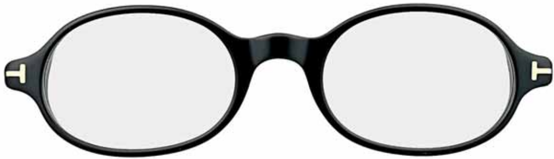
B5 NERO LUCIDO SHINY BLACK