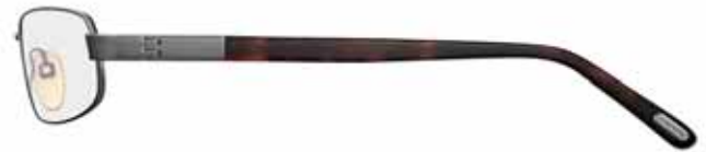
731 ANTRACITE LUCIDO, TERMINALI AVANA SCURA SHINY GUNMETAL, DARK HAVANA TEMPLE TIPS