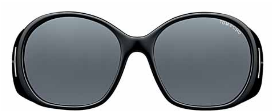
B5 NERO LUCIDO, LENTI FUMO SHINY BLACK, DARK GREY LENSES