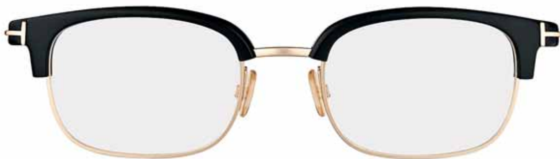
B5 ORO ROSÈ LUCIDO, NERO LUCIDO SHINY ROSE GOLD, SHINY BLACK