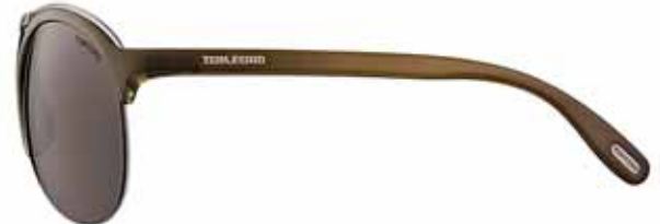
T50 MARRONE/VERDE OLIVA, BARRA ANTRACITE LUCIDO, LENTI MARRONE BROWN/OLIVE GREEN, SHINY GUNMETAL TOP BAR, BROWN LENSES