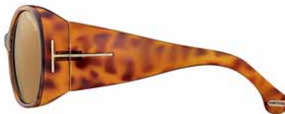
379 AVANA CHIARA LUCIDA, LENTI MARRONE SHINY LIGHT HAVANA, BROWN LENSES