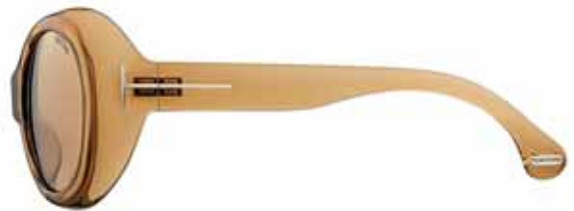
614 CHAMPAGNE LUCIDO, LENTI MARRONE CHIARO SHINY CHAMPAGNE, LIGHT BROWN LENSES