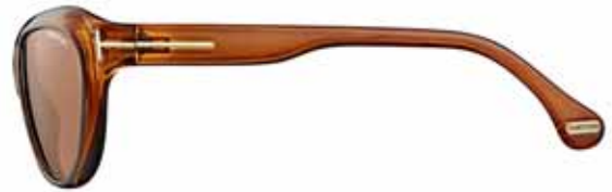
600 MARRONE TRASPARENTE, LENTI MARRONE CHIARO TRANSPARENT BROWN, LIGHT BROWN LENSES