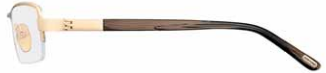
772 ORO ROSÈ LUCIDO, TERMINALI MARRONE RIGATO SHINY ROSE GOLD, STRIPED BROWN TEMPLE TIPS