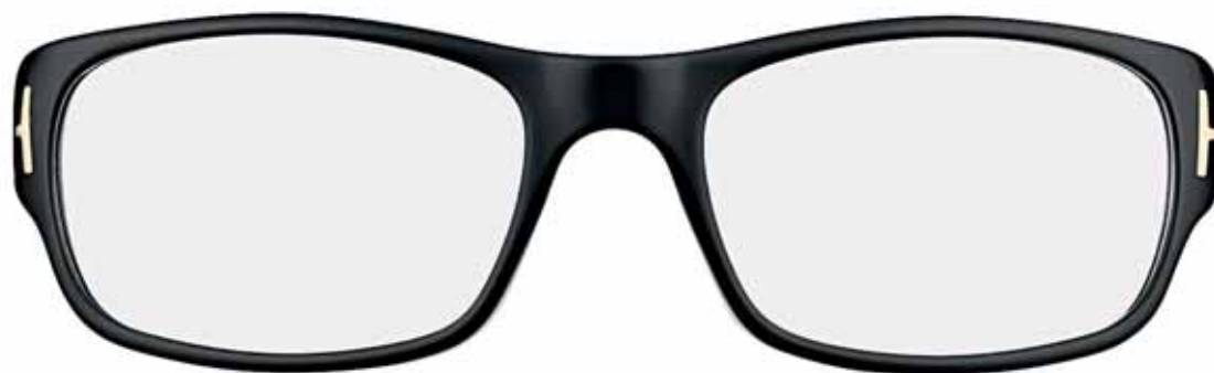
B5 NERO LUCIDO SHINY BLACK