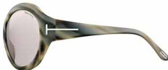
599 CORNO OLIVA LUCIDO, LENTI CIPRIA SHINY OLIVE HORN, POWDER LENSES