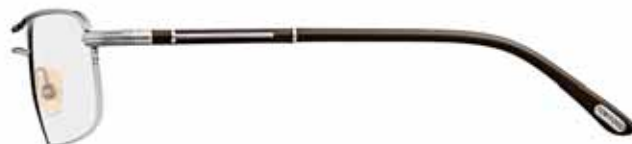
753 RUTENIO CHIARO LUCIDO, SMALTO VERDONE, TERMINALI VERDONE SHINY LIGHT RUTHENIUM, DARK GREEN EPOXY, DARK GREEN TEMPLE TIPS