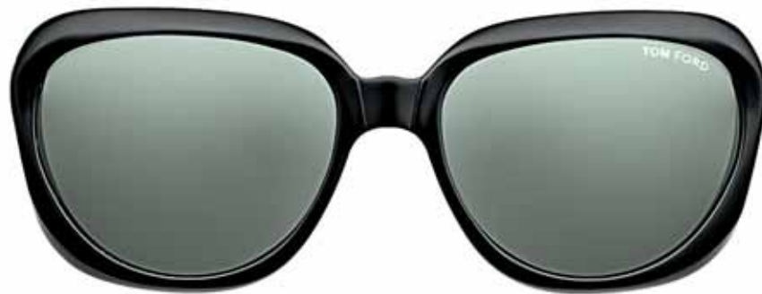
B5 NERO LUCIDO, LENTI VERDE BOTTIGLIA SHINY BLACK, GREEN LENSES