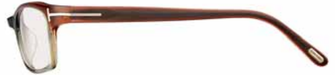
412 MARRONE CHIARO SFUMATO VERDE OLIVA SHADED LIGHT BROWN/OLIVE GREEN