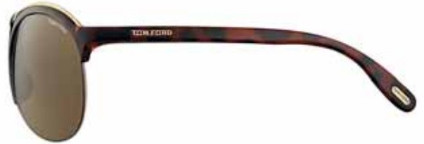
820 AVANA SCURA LUCIDA, BARRA ORO ROSÉ LUCIDO, LENTI ROVIEX SHINY DARK HAVANA, SHINY ROSE GOLD TOP BAR, ROVIEX LENSES