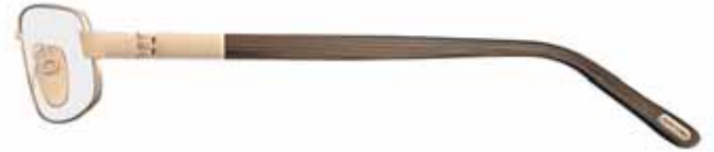
772 ORO ROSÈ LUCIDO, TERMINALI MARRONE RIGATO SHINY ROSE GOLD, STRIPED BROWN TEMPLE TIPS