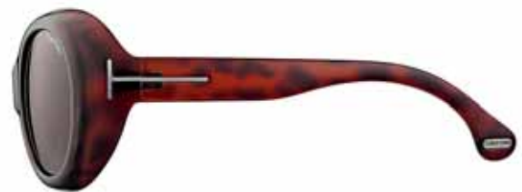
182 AVANA SCURA LUCIDA, LENTI MARRONE SCURO SHINY DARK HAVANA, DARK BROWN LENSES