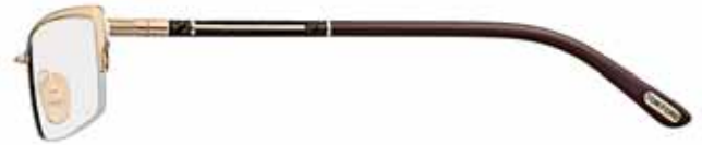
772 ORO ROSÉ LUCIDO, SMALTO MARRONE PERLATO, TERMINALI MARRONE SHINY ROSE GOLD, PEARL BROWN EPOXY, BROWN TEMPLE TIPS