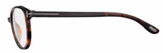
820 AVANA SCURA LUCIDA SHINY DARK HAVANA