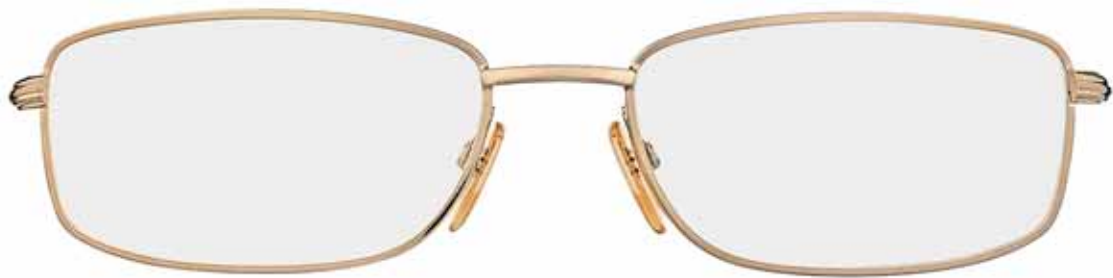
F90 ORO ROSÉ LUCIDO, SMALTO BORDEAUX, TERMINALI BORDEAUX SHINY ROSE GOLD, BURGUNDY EPOXY, BURGUNDY TEMPLE TIPS