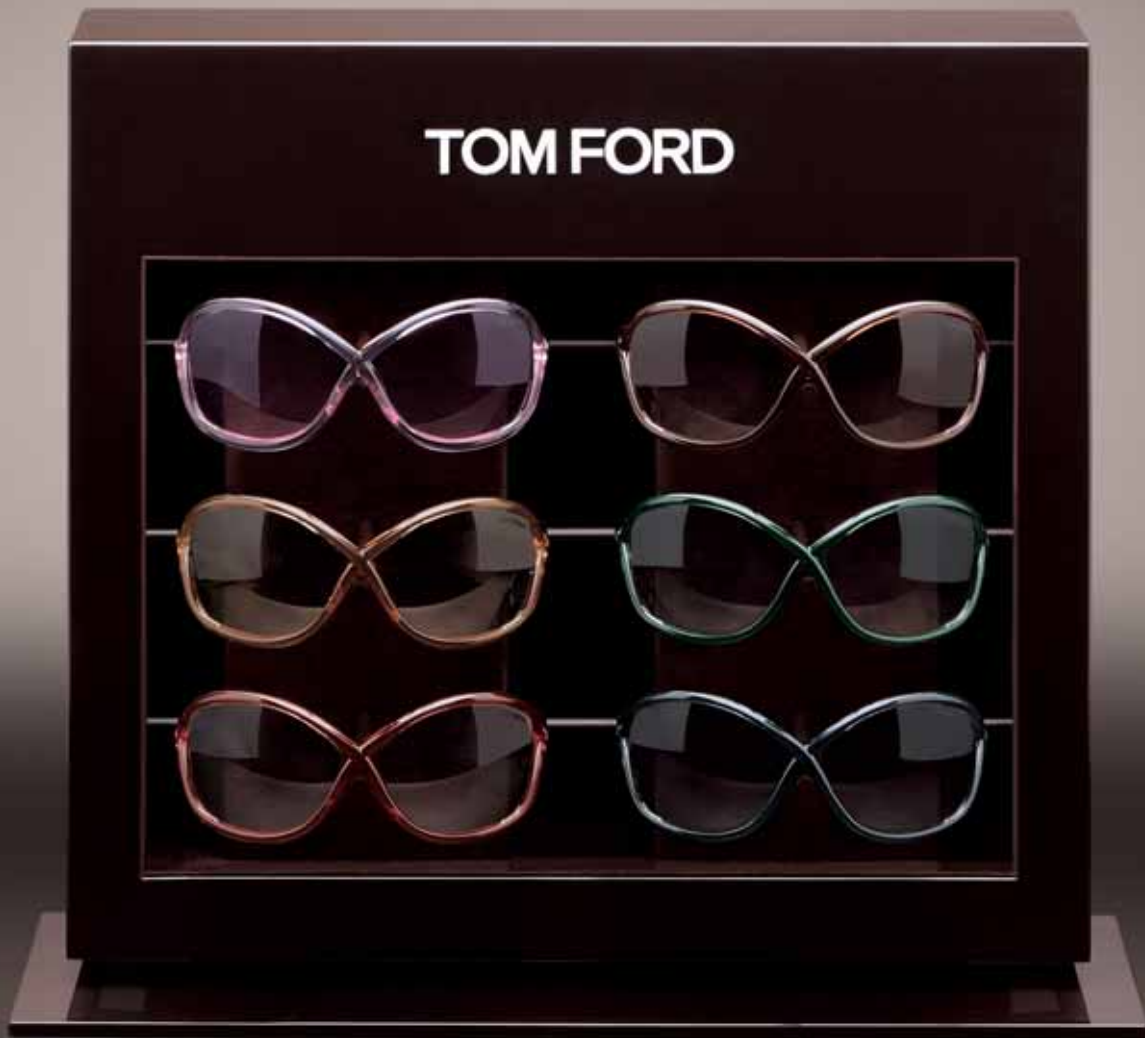
SIX PIECE DISPLAY UNIT