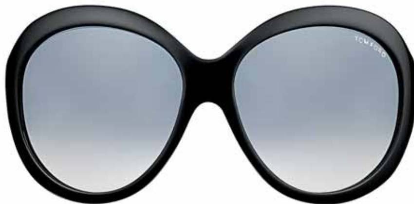
B5 NERO LUCIDO, LENTI FUMO SFUMATO SHINY BLACK, GRADIENT DARK GREY LENSES