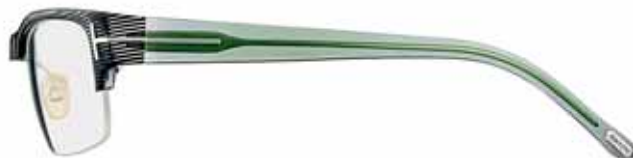
568 VERDE/NERO/VIOLA TRASPARENTE RIGATO STRIPED GREEN/BLACK/TRANSP. VIOLET