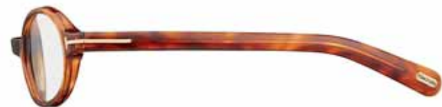
379 AVANA BIONDA LUCIDA SHINY BLONDE HAVANA