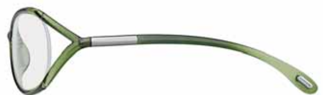
437 VERDE SMERALDO TRASPARENTE TRANSPARENT EMERALD GREEN