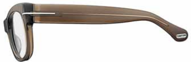
328 MASTICE LUCIDO SHINY MASTIC BROWN