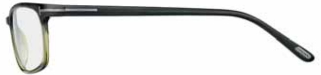
T94 BICOLORE GRIGIO/OLIVA BICOLOUR GREY/OLIVE