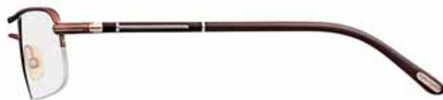
517 MARRONE SEMILUCIDO, SMALTO MARRONE SCURO, TERMINALI MARRONE SCURO SEMI-SHINY BROWN, DARK BROWN EPOXY, DARK BROWN TEMPLE TIPS