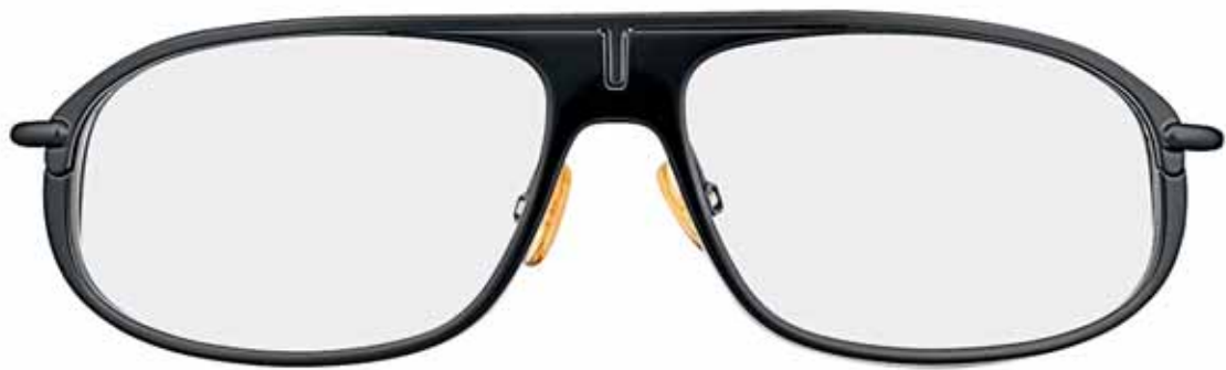
B5 NERO LUCIDO, METALLO NERO SEMILUCIDO SHINY BLACK, SEMI-SHINY BLACK METAL