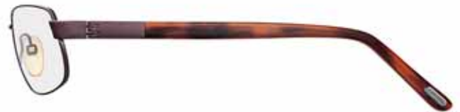
728 VINACCIA LUCIDO, TERMINALI CORNO ROSSO/MATTONE/VIOLA SHINY WINE RED, RED HORN/BRICK RED/VIOLET TEMPLE TIPS