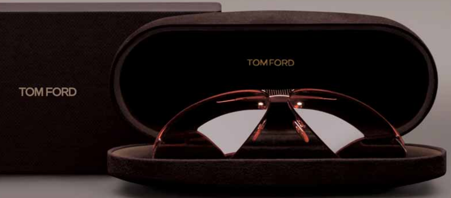
MEN'S HARD CASE WITH OUTER BOX