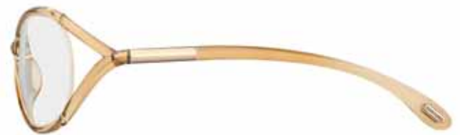
614 CHAMPAGNE TRASPARENTE TRANSPARENT CHAMPAGNE