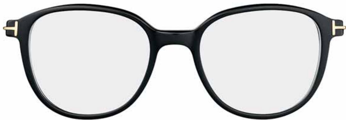
B5 NERO LUCIDO SHINY BLACK