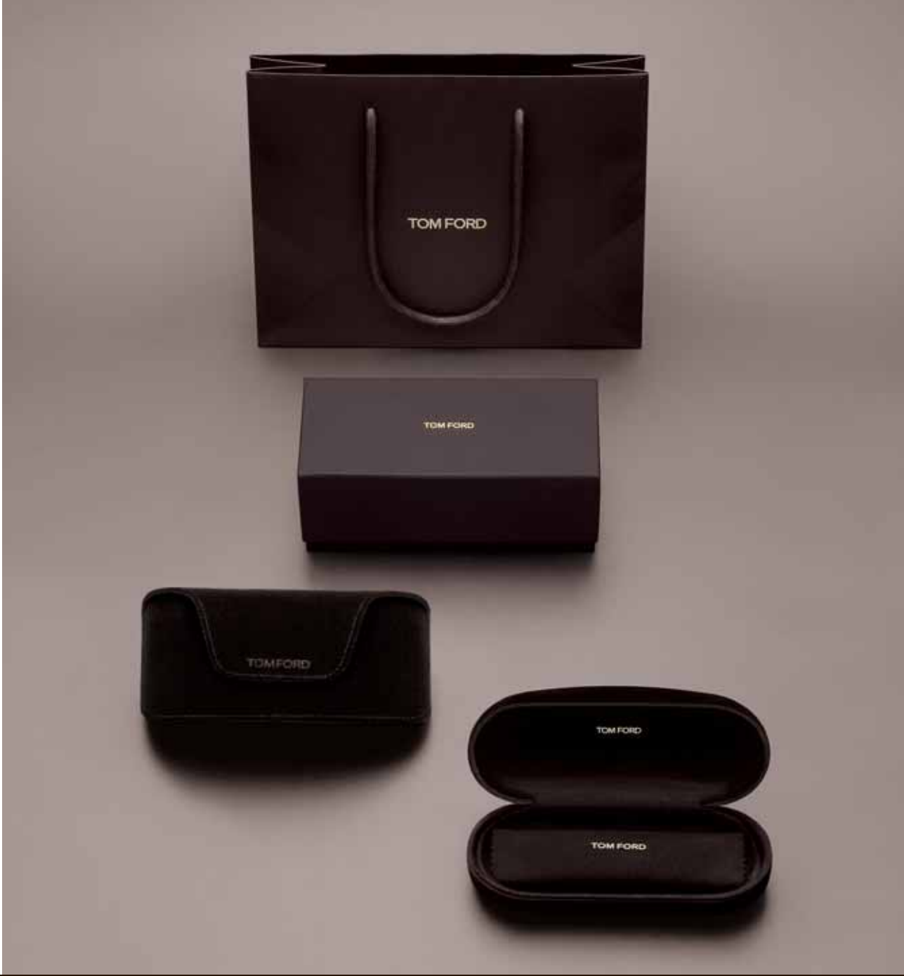
WOMEN'S PACKAGING SAMPLES