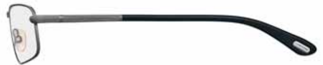
731 ANTRACITE SEMILUCIDO, TERMINALI NERO LUCIDO SEMI-SHINY GUNMETAL, SHINY BLACK TEMPLE TIPS