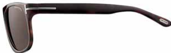
820 AVANA SCURA LUCIDA, LENTI MARRONE SCURO SHINY DARK HAVANA, DARK BROWN LENSES