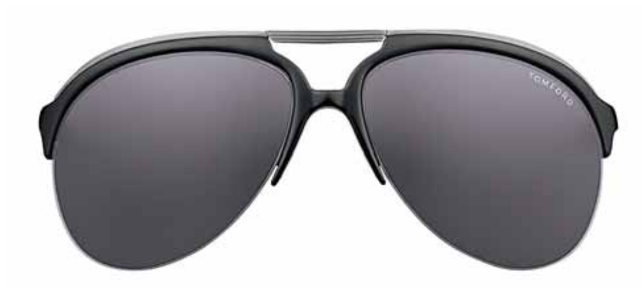
B5 NERO LUCIDO, BARRA ANTRACITE LUCIDO, LENTI FUMO SHINY BLACK, SHINY GUNMETAL TOP BAR, DARK GREY LENSES