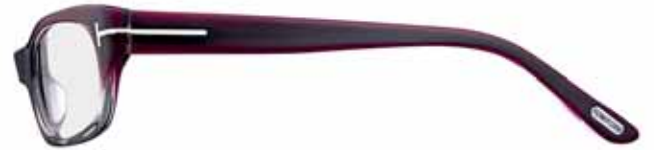
411 VIOLA SFUMATO GRIGIO SHADED VIOLET/GREY