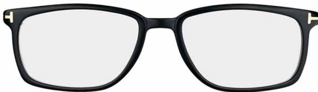
B5 NERO LUCIDO SHINY BLACK