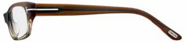
412 MARRONE CHIARO SFUMATO VERDE OLIVA SHADED LIGHT BROWN/OLIVE GREEN