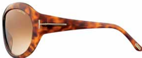
379 AVANA CHIARA LUCIDA, LENTI MARRONE SFUMATO SHINY LIGHT HAVANA, GRADIENT BROWN LENSES