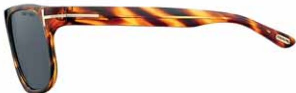
T33 AVANA ROSSA STRIATA, LENTI FUMO STRIPED RED HAVANA, DARK GREY LENSES