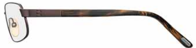
J63 MARRONE SCURO SEMILUCIDO, TERMINALI CORNO MARRONE/MARRONE CHIARO/MARRONE SCURO SEMI-SHINY DARK BROWN, BROWN HORN/LIGHT BROWN/ DARK BROWN TEMPLE TIPS